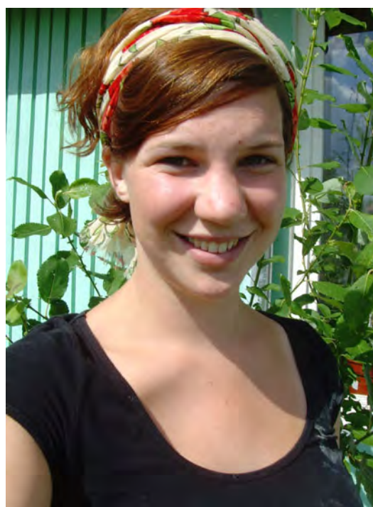
Sommertur 2011 – reparering og pussing av bolighus Serafin.