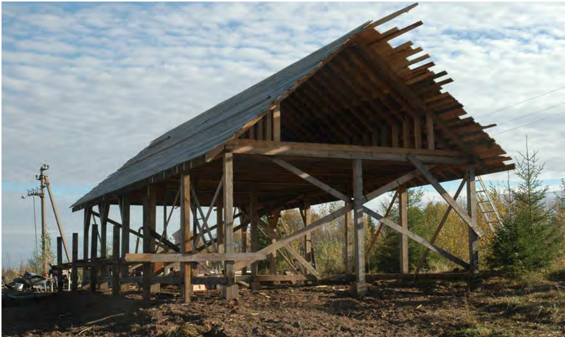
Høstturer 2011 – nytt verktedbygg for Svetlana.