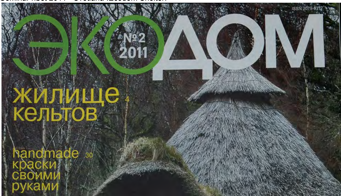
Russisk magasin om „Ecodom“ – naturlige byggeteknikker.