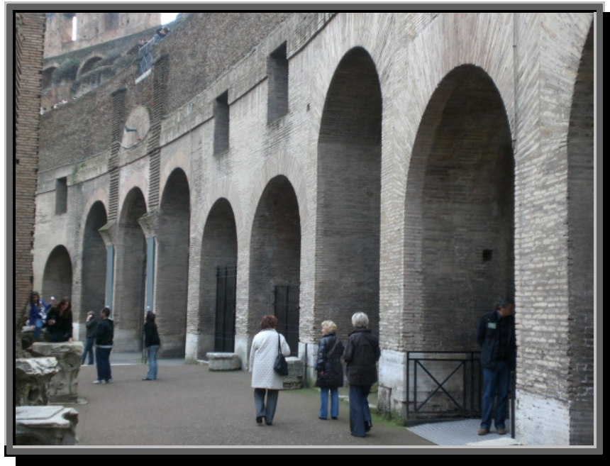
Godt murverk er varig, her fra Colosseum i Roma

Råmaterialene til mineralske byggematerialer er leire, sand, grus og ulike bergarter. De finnes bokstavelig talt så godt som overalt og har oftest vært utvunnet og nyttet i lang tid. Det mest bærekraftige er å utvinne dem nærmest mulig der de skal anvendes. Problemet med utvinningen er at den kan forstyrre landskapet, samt at viderebearbeidingen innebærer energikrevende og miljøbelastende innslag.