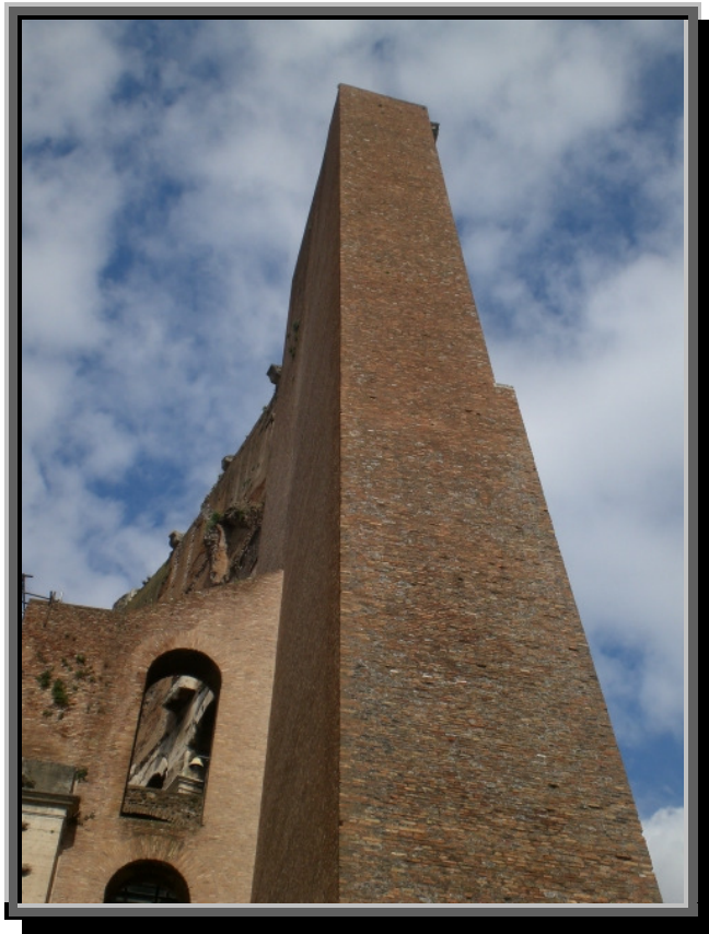
Detalj fra Colosseum

Av konstruksjonstegl finnes det tre hovedtyper i bruk: massiv stein, hulltegl og lettegl. I tillegg har vi zytanblokken, som er brent sammen av ekspanderte leirekuler. Hullteglet er det vanligste. Her sparer man leire, samtidig som isolasjonsevnen øker noe. I tillegg er den lettere, og den gir fastere konstruksjoner ved å binde bedre til mørtelen. Hullene må imidlertid være så små at det ikke glir mørtel ned i dem og fyller dem opp. I Norge forhandles hulltegl i