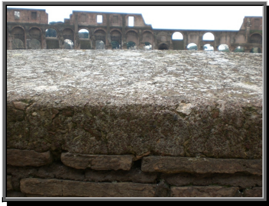
Pozzolansement er en romersk oppfinnelse

Betong ble oppfunnet av romerne og er i dag et av våre viktigste byggematerialer. Den kan gytes i alle slags former og kan med forskjellige tilsetser oppfylle de fleste krav. Betong består av en blanding av sement, sand, grus og pukk, der tilslaget bør være rundest mulig og godt gradert, slik at partiklene glir godt sammen og danner en kompakt masse.