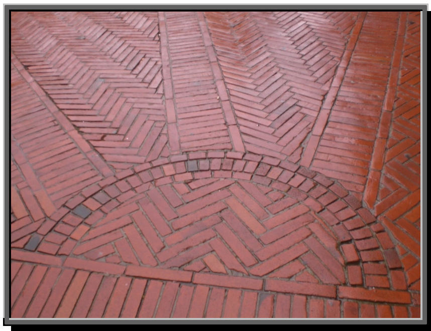
Utsnitt fra et teglsteinsbelagt middelaldertorg, San Gimignano, Toscana

Råvaren til tegl er en blanding av leirer, som ofte iblandes emner som gir porer i teglet (sagspon og cellulose – unipor-systemet) eller kuler av polystyren (poroton-systemet, gir dårlig fuktregulerende makroporer). Denne blandingen presses gjennom et munnstykke som gir massen de blivende steinenes form og evt. hull, som skjæres av i rette lengder. Råteglsteinene plasseres deretter i et tørkerom som varmes av hovedovnens overskuddsvarme. Siden transporteres de inn i den tunnelformede hovedovnen, hvor de tørre leirsteinene brennes ved en temperatur mellom 800 og 1200 grader i snaut tre timer. Under brenningen brenner sagsponene eller polystyrenkulene opp og etterlater varmeisolerende porer. På det meste var det nærmere 200 teglverk i Norge, i dag har vi kun ett tilbake, Bratsberg Teglverk i Telemark. Her ligger også Nasjonalt Teglsenter, hvor du kan skaffe deg den informasjon du trenger om dette vakre materialet, www.nasjonalt-teglsenter.no .