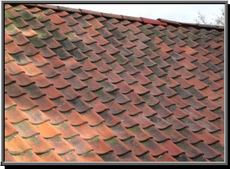
Livfullt gammelt tegtak

I boka A Pattern Language av Christopher Alexander m. fl. tar ”pattern” 248 for seg hvordan man selv kan lage egenproduserte gulvtegl. Gulvtegl må være myk, både fordi dette gjør den bedre å gå på, og fordi det er viktig at slitasjen kan forme gulvet, som et vitnesbyrd over tidens gang og levd liv. ”Pattern” 233 gir en innføring i hvilke deler av gulvet som bør kles med gulvtegl eller -fliser, og for hvilke områder man bør bruke tregulv, samt hvordan man utfører overganger mellom ulike materialer.