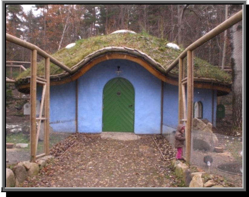
Lite leirpusset halmhus