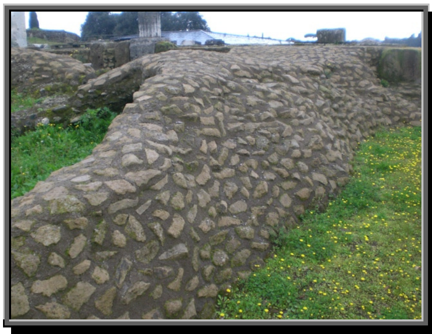
Rester av betongarbeider på Palatinerhøyden

Dekker og andre åpne flater er særlig utsatt for uttørking. Det er ikke bare temperaturen, men også vinden som bidrar til det. Dagens praksis ved støyping av dekker medfører ofte at betongoverflaten tørker ut rett etter utstøypingen. Denne tidlige uttørkingen fører til at den ferske massen trekker seg sammen (tørkespenninger). Dersom sammentrekningen er større enn evnen i massen til å motstå tøyningene, oppstår det riss. Rissene kalles plastiske svinnriss fordi de oppstår mens betongen ennå er plastisk, altså før størkningen er avsluttet. Dette er alvorlig, da det kan føre til vann- og radoninntrengning, frostspreng og hurtig nedbrytning av armering og betong. Spyl derfor på vann så raskt som mulig etter utstøyping og dekk til betongoverflata med plast.