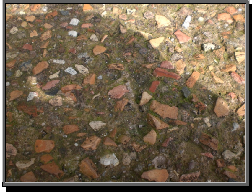
Gjenbruk av tegl i Colosseum

Tegl som av ulike grunner ikke lar seg dekomponere, kan males opp til teglsteinsmel, som under visse forutsetninger kan brukes som pozzolantilsetning i sementer. Større teglbiter kan nyttes som tilslag i betong.