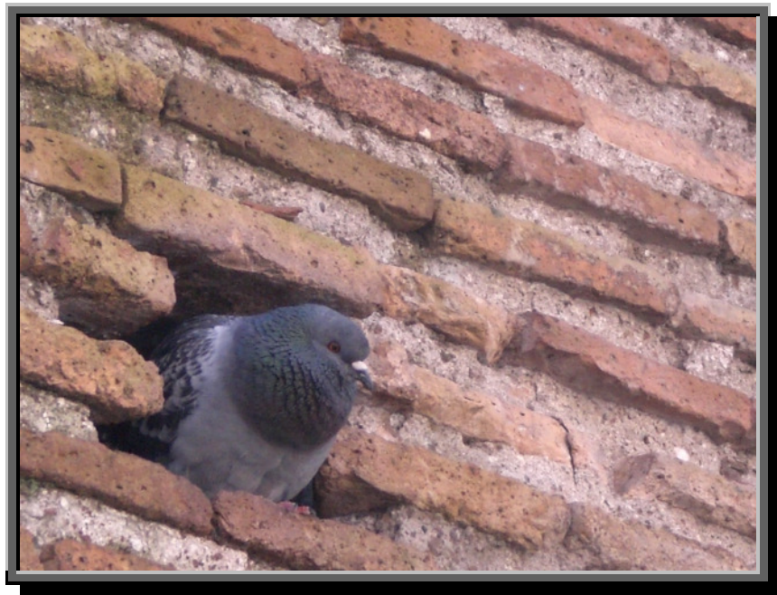
Man kan også ta miljøhensyn ved å mure inn gode hekke- og hvileplasser